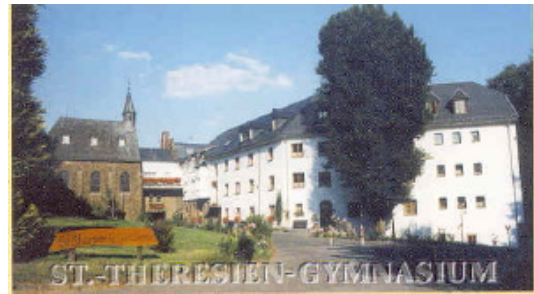
Sankt-Theresien-Gymnasium in Schönenberg