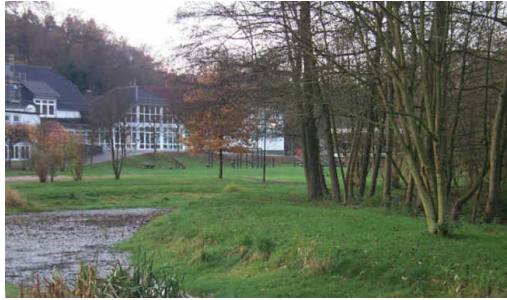
Grundschule Schönenberg am Brölbach