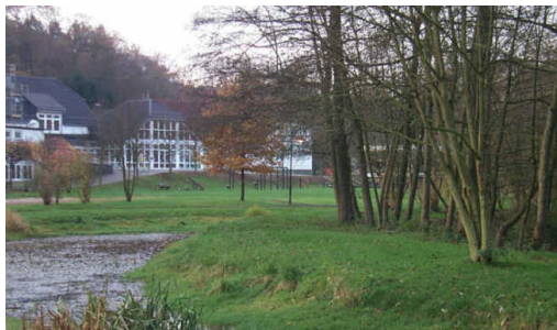
Grundschule Schöenberg am Brölbach