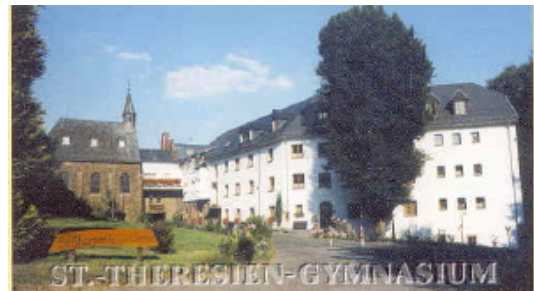
Sankt-Theresien-Gymnasium in Schöenberg