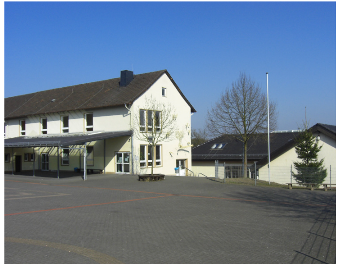
Sekundarschule Nümbrecht/Ruppichteroth – Standort Ruppichteroth - und Hauptschule Ruppichteroth